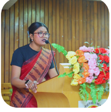
Project Lab Technician ICMR-NIN Project