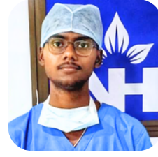
OT Assistant NH Multispeciality Hospital, Barasat

আর্থিক প্রতিবন্ধকতা কাটিয়ে বর্তমানে ICMR-NIN প্রকল্পে কর্মরত। মাসিক উপার্জন ১৮০০০/- ।