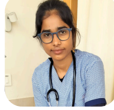
Patient Care Assistant Tata Medical Centre, Kolkata

কালিম্পঙ- এর পাহাড়ে জন্ম ও বড় হয়ে ওঠা। বর্তমানে দক্ষিণ ভারতের ব্যাঙ্গালোরে কর্মরত। মাসিক উপার্জন ১৯০০০ টাকা।