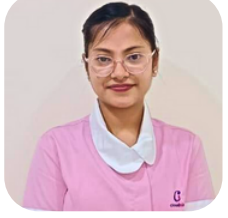
General Duty Assistant Cloud Nine Hospital, Bangalore

বীরভূমের প্রত্যন্ত গ্রাম থেকে SFS - এ প্রশিক্ষণের মাধ্যমে বর্তমানে হাসপাতালে কর্মরত। মাসিক উপার্জন ১৮০০০/-।