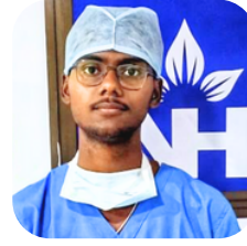
OT Assistant NH Multispeciality Hospital, Barasat

वित्तीय बाधाओं को दूर करते हुए वर्तमान में ICMR-NIN प्रोजेक्ट पर काम कर रहे हैं। मासिक कमाई 18000/-