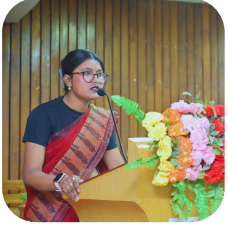
Project Lab Technician ICMR-NIN Project